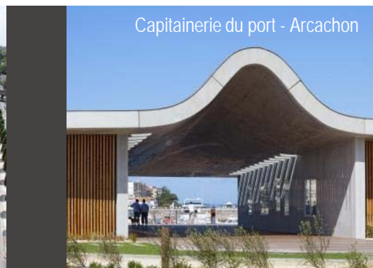
Capitainerie du port - Arcachon