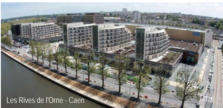
Les Rives de l'Orne - Caen

En 2012, Ramery bâtiment acquiert Snegso, une entreprise générale de bâtiment implantée à Bordeaux [33] et à Bayonne [64]. Un an après cette acquisition, Ramery bâtiment signe à Bordeaux le plus gros chantier de son histoire.