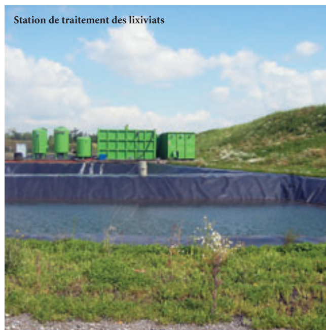
Station de traitement des lixiviats