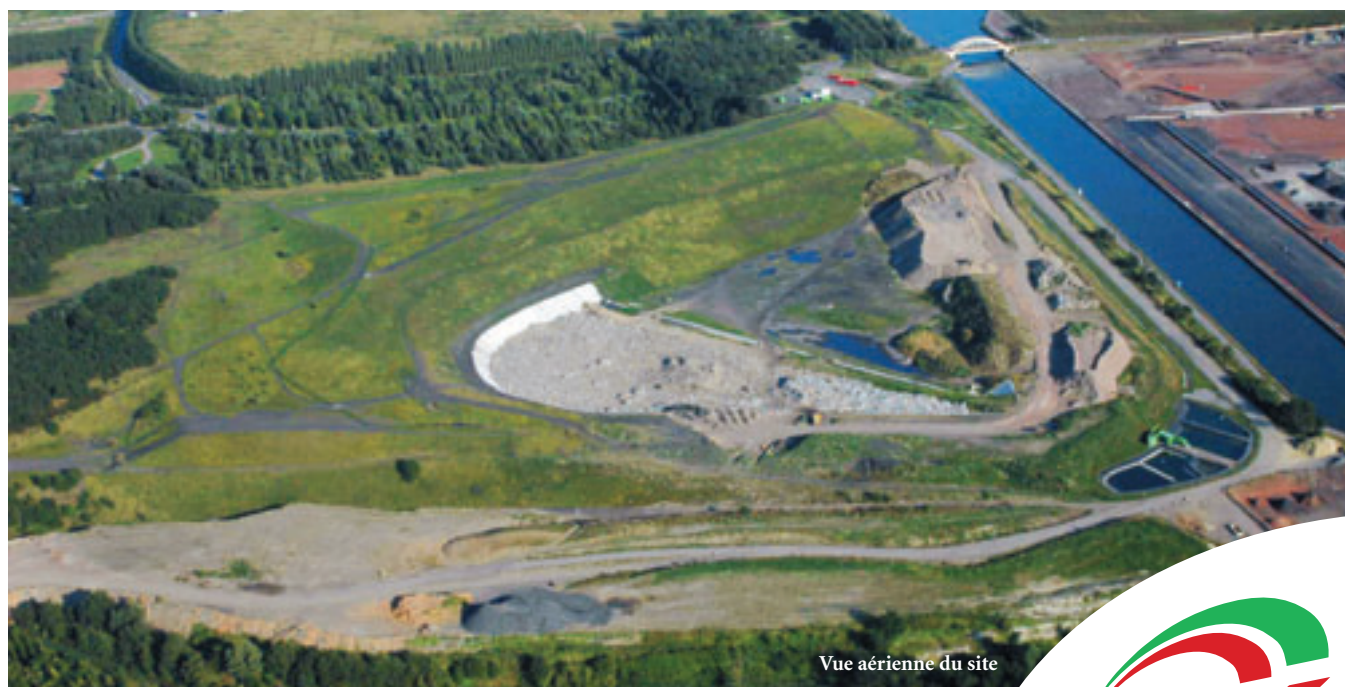
Vue aérienne du site

Le centre accueille exclusivement des Déchets Industriels Banals et des terres faiblement polluées. Un traitement et un contrôle des eaux de surface et des lixiviats permettent de garantir leur qualité lors de leur rejet. En fin d'exploitation, chaque zone bénéficie d'un aménagement paysager.