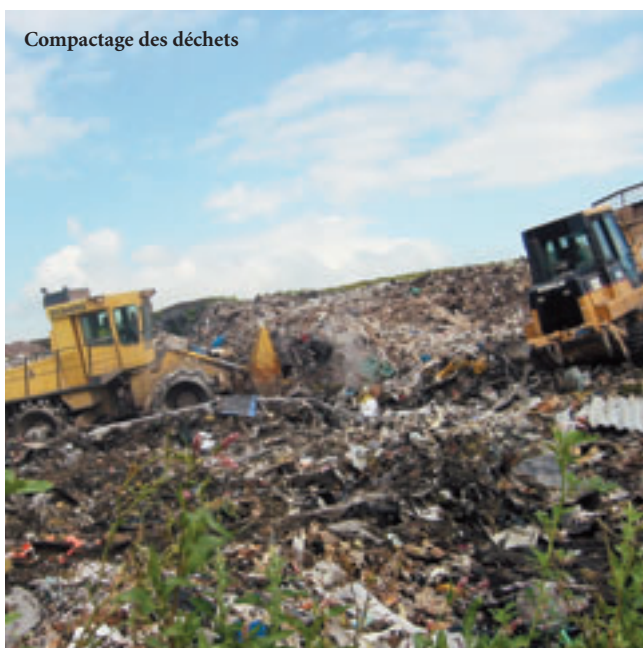
Compactage des déchets