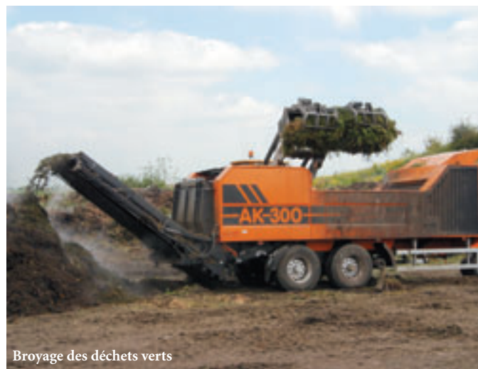
Broyage des déchets verts