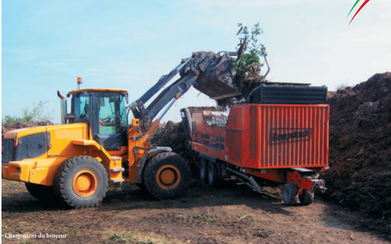
Chargement du broyeur