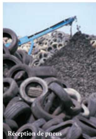
Réception de pneus

Les débouchés d'utilisation du broyat drainant obtenu après recyclage des pneumatiques sont de plus en plus nombreux :