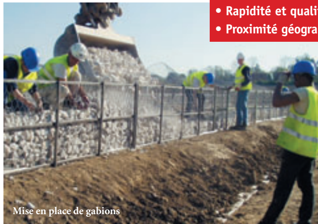
Mise en place de gabions