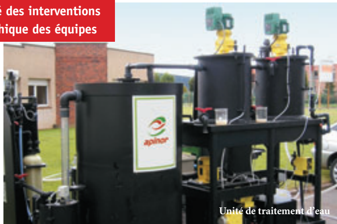
Unité de traitement d'eau