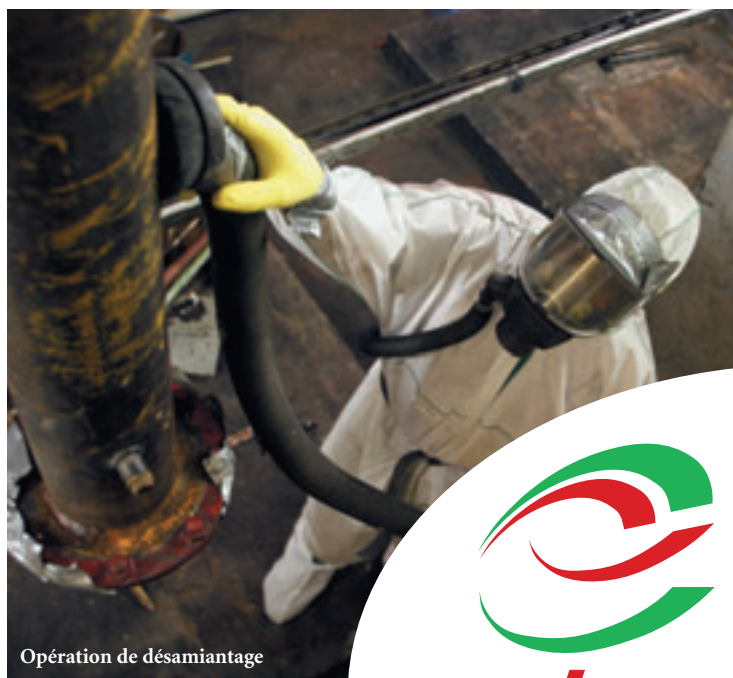
Opération de désamiantage