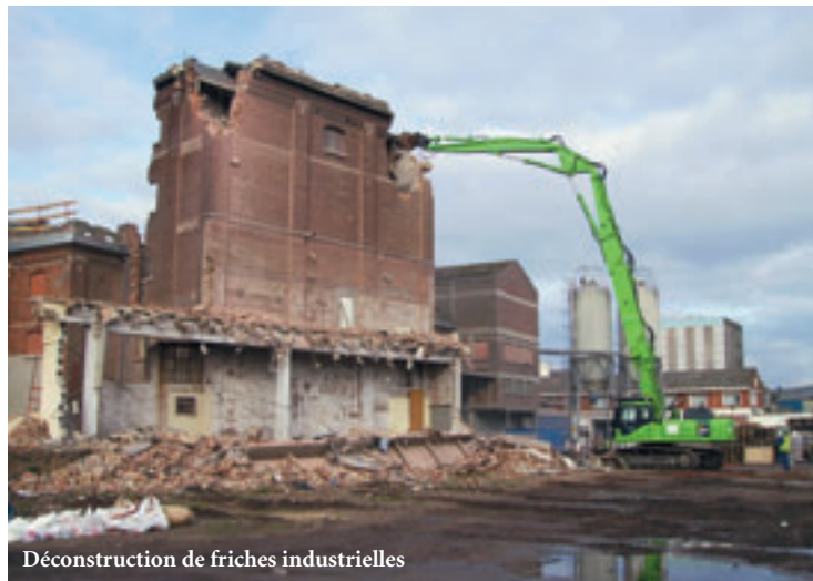
Déconstruction de friches industrielles

Des équipes formées et un matériel adapté assurent à nos clients publics et privés une qualité d'intervention contrôlée. Pour une maîtrise globale de chantiers exigeant des prestations complémentaires, nous nous appuyons sur nos sociétés partenaires au sein de la Nordiste de l'environnement.