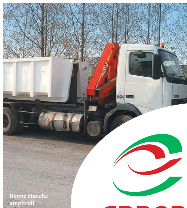
Benne étanche ampliroll

ZI - Rue Rhorez 62730 LES ATTAQUES Tél. : 03 21 96 70 01 Fax : 03 21 97 59 90